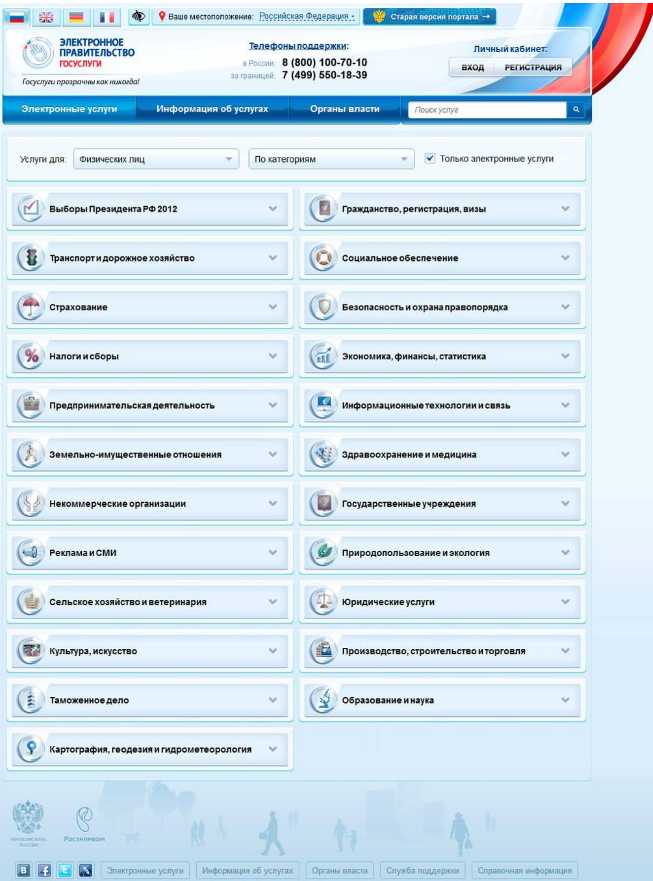
Рис. 5.1. Электронные государственные услуги по категориям